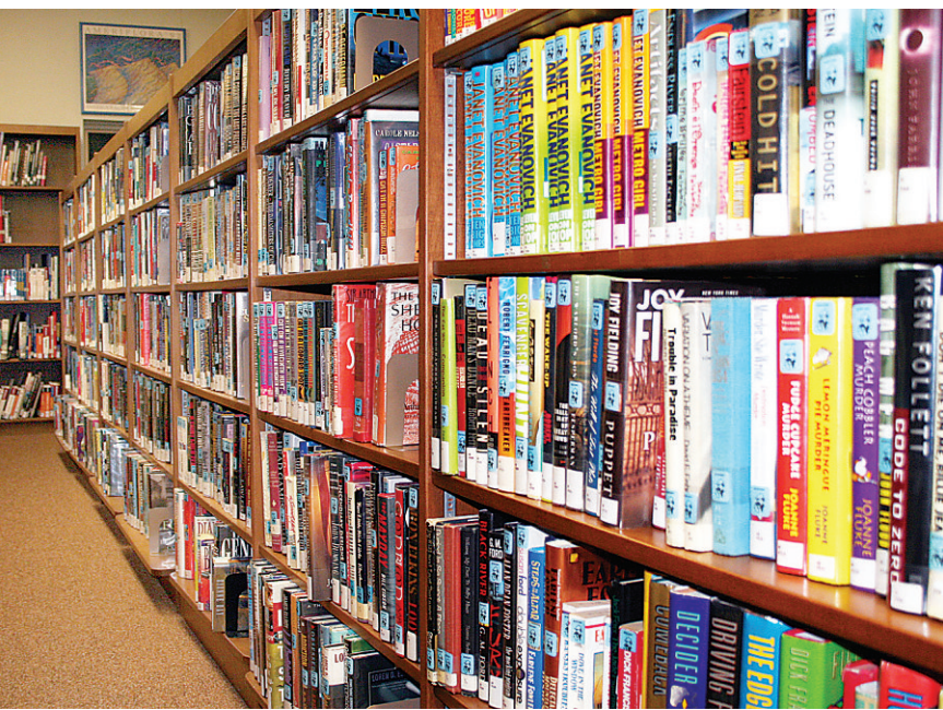
La Bibliothèque publique de Grand-Sault offre une gamme d'activités sur une base hebdomadaire. Photo contribution