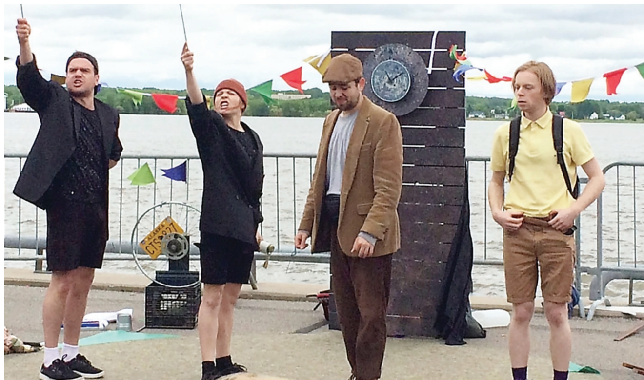
La troupe de théâtre La ruée sera de passage à Edmundston les 17 et 18 juin.

★ Pour plus d'information, appeler au 475-7781, par courriel à gfpbib@gnb.ca ou sur Facebook à www.facebook.com/bibliograndsault.grandfallslib .